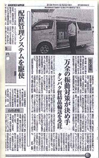
ロジスティクスニッポン 2013年6月27日