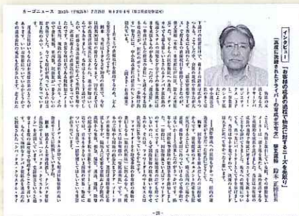
カーゴニュース 2013年7月23日号

大阪大学発ベンチャー企業の株式会社創晶からの業務委託により、2年近い試行錯誤を得て、事業化に成功。2013年4月より、もろくて損傷を受けやすいタンパク質結晶を、一定の温度を維持しながら、強い衝撃を与えないように輸送しています。これによりハンドキャリアで運ぶ手間やリスク（衝撃・温度管理）がなくなりました。