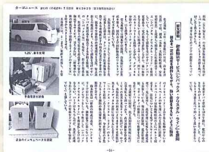
カーゴニュース 2013年7月25日号